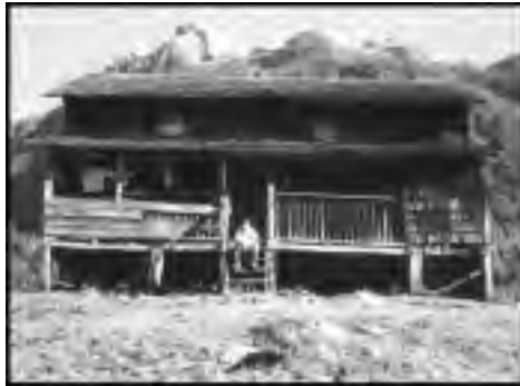
Casa de colonos llegados en 1930

tipo de explotación depredatoria que hizo posible el establecimiento de colonos mientras duraron esos recursos ya no es posible. La ganadería es la actividad que ha tenido el mayor impacto sobre el medio ambiente, producto de la necesidad de eliminar el bosque para habilitar praderas. El recurso tradicional ha sido la quema, lo que en numerosos casos fue causa de incendios que escaparon a todo control, especialmente en la zona cordillerana.