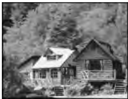
Cabañas de turismo, Caleta Gonzalo