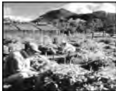
Huerto de predio productivo

de miel, ubicada en el predio Pillán, tiene aproximadamente 1.000 metros cuadrados y una capacidad para procesar 80 toneladas de miel al año, lo que la convierte en tal vez la mayor planta del país. Está equipada con maquinaria de acero inoxidable, sistema de calefacción, estanques de decantación, sala de envasado, sala de producción y reciclaje de cera, un laboratorio para diagnóstico de enfermedades, oficinas para los trabajadores, cuatro departamentos y un taller carpintero en plena producción para la fabricación de material apícola.