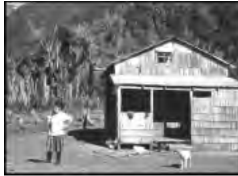
Casa de colonos actuales