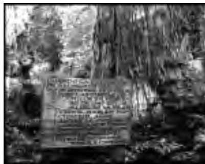
Sendero Los Alerces