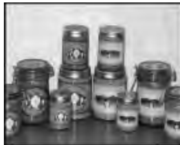
Miel y conservas

Durante los últimos dos años la actividad frut TM cola ha comenzado a tener gran importancia para el Proyecto. La plantación de especies frutales se pensó inicialmente como experimental, y parte de las actividades de recuperación de suelos para fines agrícolas. Sin embargo se ha ido aumentando paulatinamente la superficie de frutales con el objetivo de producir frutos para la elaboración de deshidratados, mermeladas, conservas y pulpa como productos orgánicos, para lo cual el programa se propone conseguir dicha certificación. Las condiciones de trabajo derivadas del clima, distancia de los centros de consumo y la seria limitación de los suelos imponen restricciones a la actividad, si es que ésta no se hace de modo diferente al tradicional. Esto implica una labor permanente de investigación e innovación a fin de desarrollar una forma de producción adecuada a las condiciones descritas, sobre todo en lo que respecta a variedades que se adapten mejor a las condiciones locales. Es así como en la actualidad se realiza un proceso de selección de individuos de la especie Ugni molinae (Murta) para propagarlo vegetativamente. Actualmente se está trabajando en los predios de Caleta Gonzalo, Reñihué, Pillán Vodudahue y Rincón Bonito, que en su conjunto totalizan una superficie inferior a 5 ha. plantadas. En el futuro inmediato se proyecta aumentar la superficie plantada en Rincón Bonito.