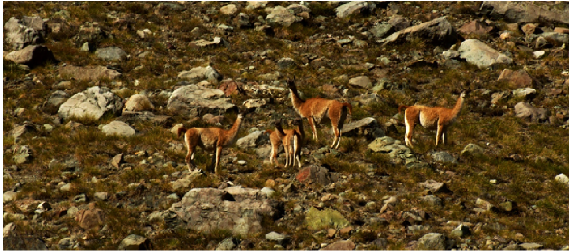
Figura 8. Cerca de la frontera con Argentina es posible observar numerosos grupos de guanacos, ausentes en gran parte del lado chileno en esta latitud