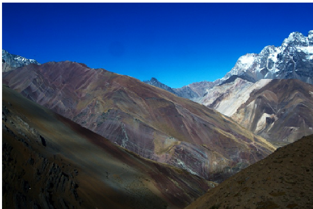
Figura 1. Fotografía que expresa la conjugación de relieve y colorido otorga al predio Cruz de Piedra un valor enorme por su mera apreciación estética