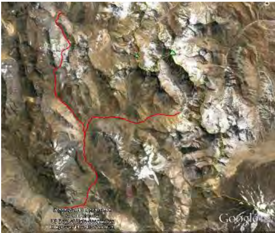
Figura 24. Desvío travesía de río Negro- Baños Colina