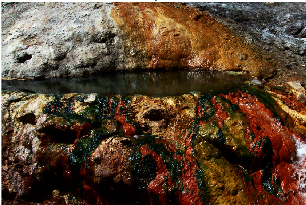
Figura 3. Colorido de las piscinas de las Termas Puente de Tierra

Los Baños de los Azules son una maravilla sedimentaria de Cruz de Piedra, correspondiendo a una serie de piscinas concéntricas de origen aparentemente calcáreo ubicadas al interior del cajón del Barroso (Figura 5). Aproximadamente cinco horas a pie se tardaría en llegar, circulando por la ribera Norte del río Barroso (detalles en sección Senderos). Durante primavera-verano, gracias a los deshielos, se llenan de agua que va cayendo a medida que las piscinas se van rebalsando.