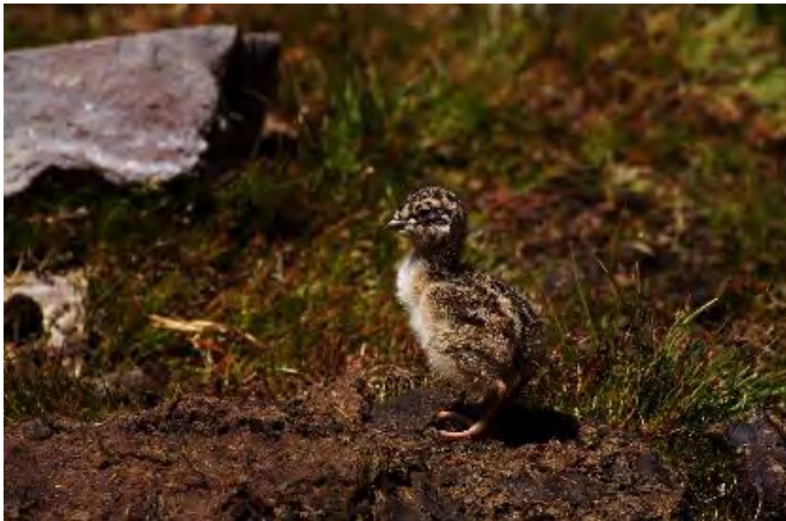
Figura 15. Polluelo de perdicita cojón en una de las vegas al costado del camino entre la avanzada Cruz de Piedra y el nacimiento del Maipo