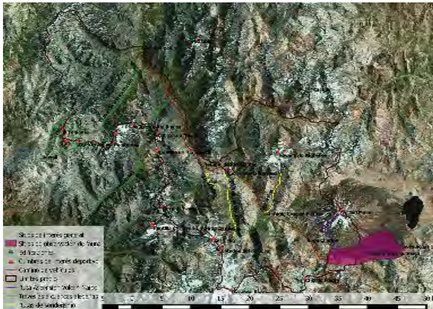
Figura 18. Resumen de zonas de interés para actividades recreativas en Cruz de Piedra