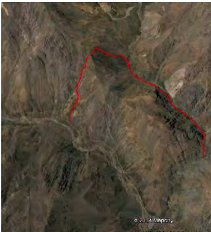
Figura 22. Tramo zona de camping Los Frangeles, Vega del Burro, Paso el Extravío