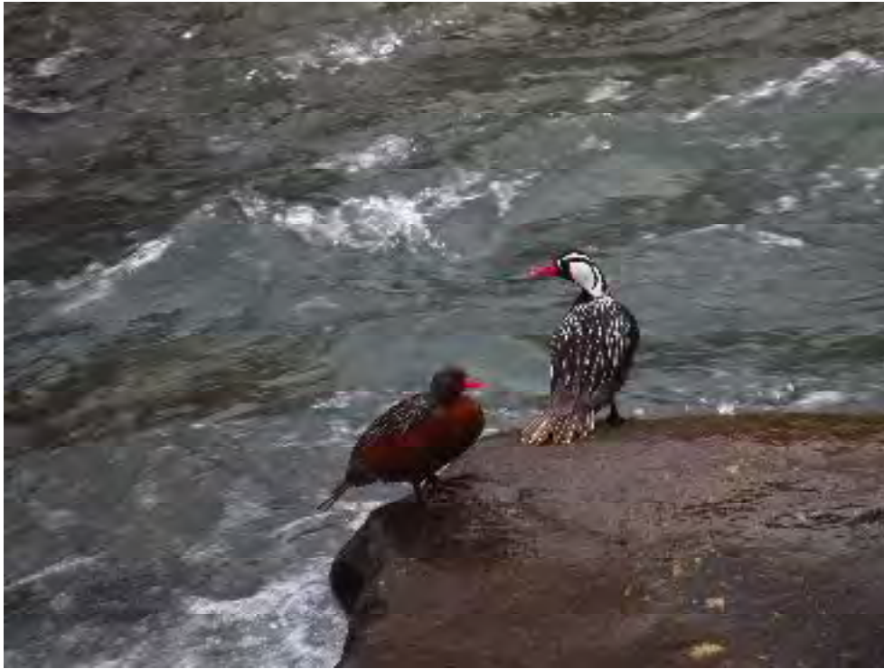
Figura 10. Pareja de patos cortacorrientes (hembra a la izquierda, macho a la derecha)