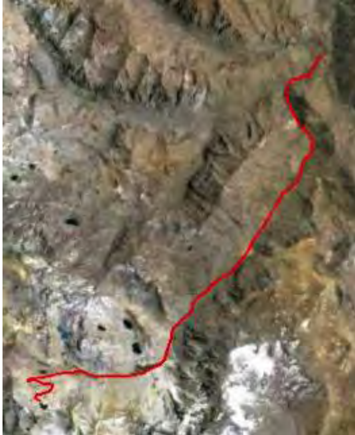
Figura 21. Travesía cabalgata río Claro-laguna La Negra

Finalmente desde aquí y con una estimación de 50 minutos, mediante un camino sin pavimentar es posible acceder en vehículo hasta Sewell y Chapa Verde.