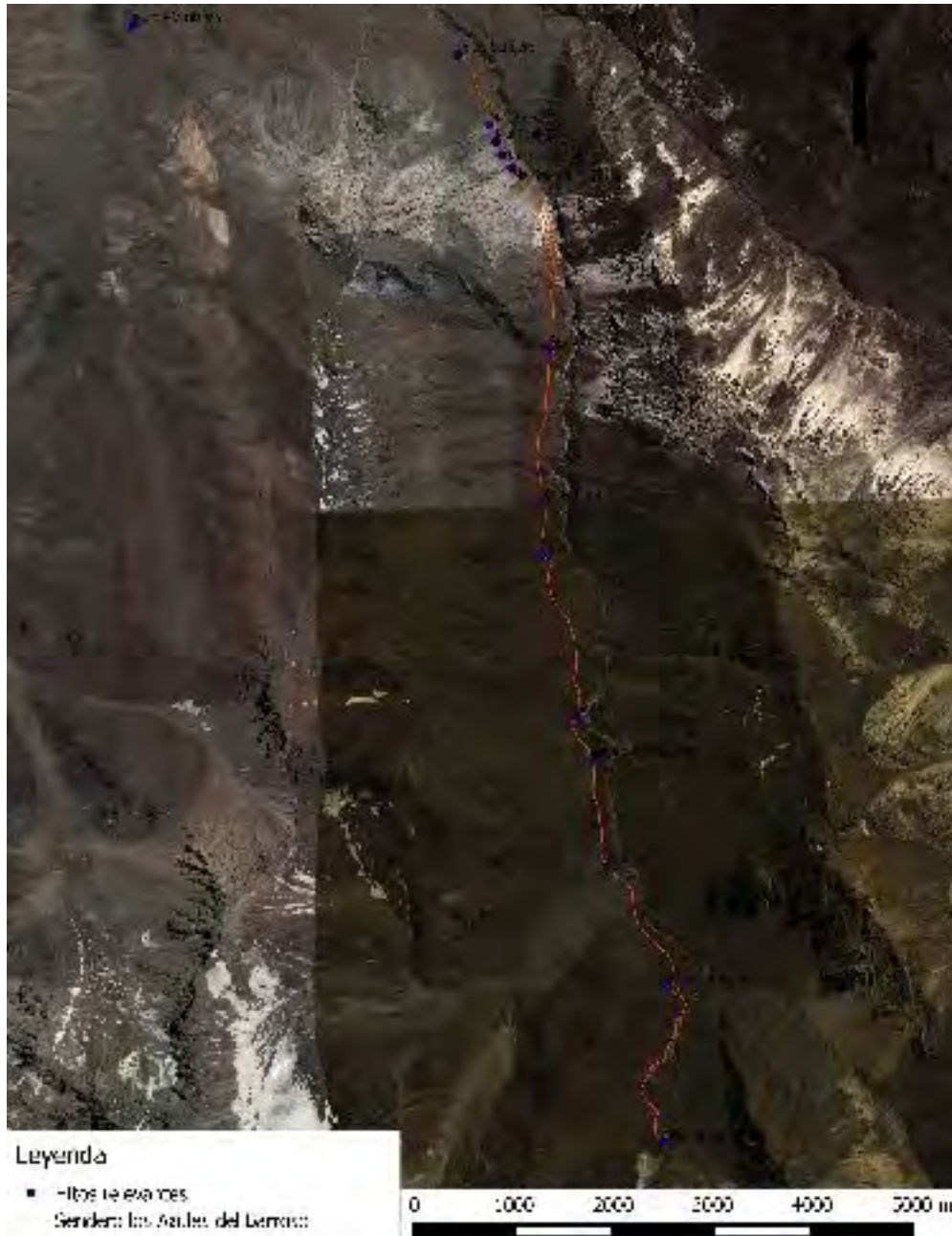
Figura 19. Trazado del sendero del Barroso, presentando sus principales hitos

condiciones de mucho viento en la cima. Asimismo, se debe llevar agua suficiente para todo el día, pues no hay fuentes para recargar líquido en toda su duración.