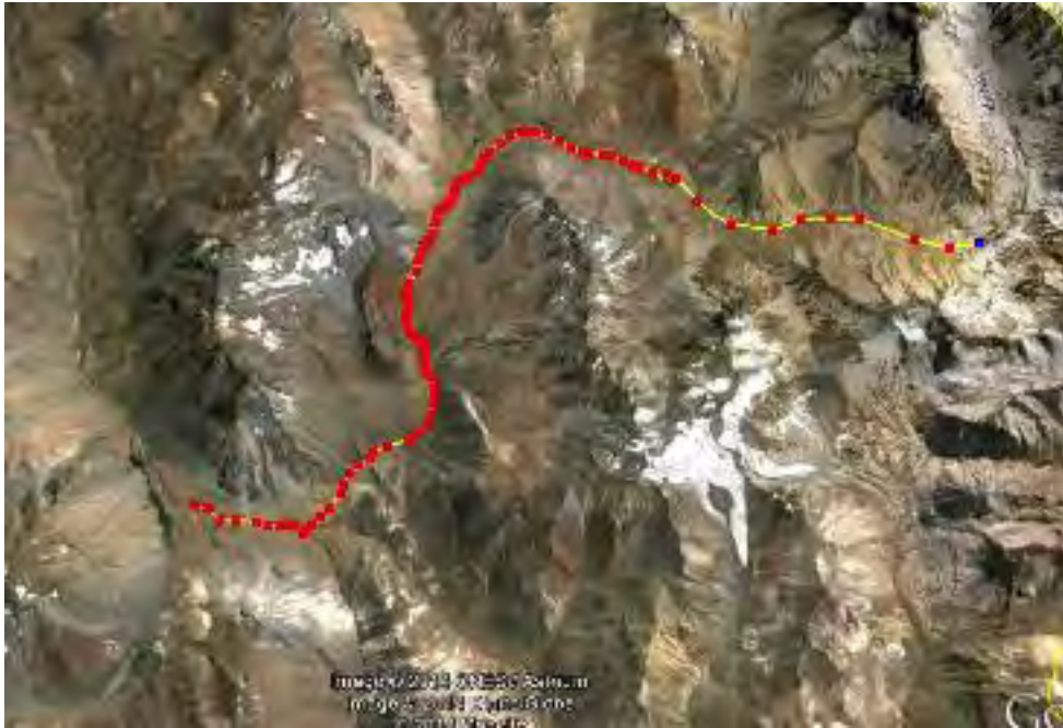
Figura 23. Travesía de río Negro- Baños Colina

Siguiendo dirección norte la ruta lleva hasta los Baños de Colina.