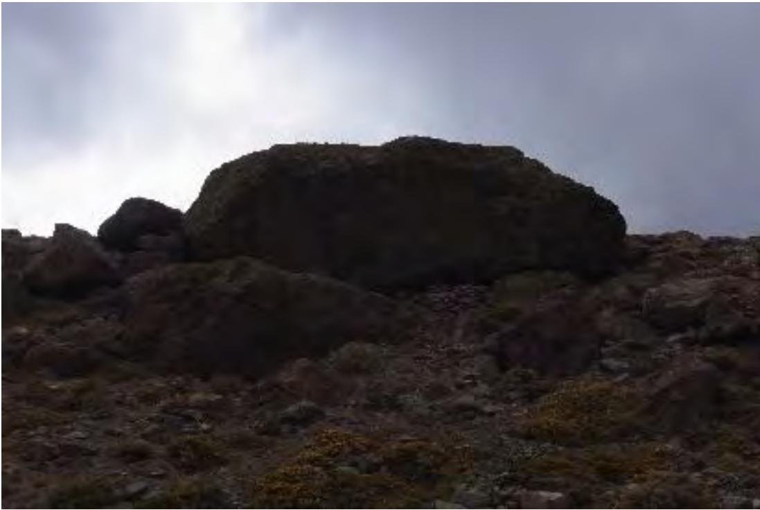
Figura 16. Refugio de puma en el Blanco