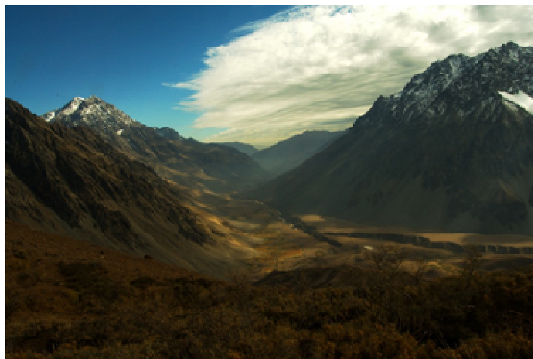
Figura 2. Fotografía de Valle del río Blanco, una de las tantas vistas que es posible tener a pocos minutos del camino de vehículo