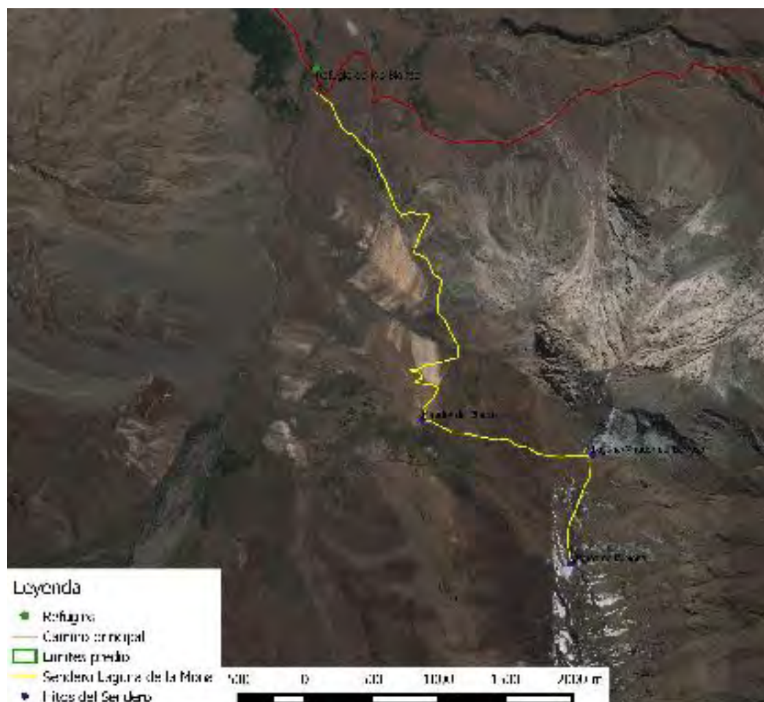
Figura 20. Sendero Laguna de la Mona