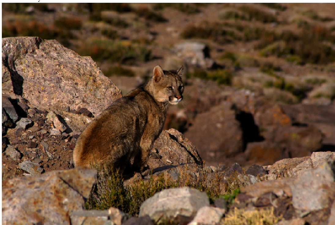
Figura 7. : El puma ( Puma concolor ) depredador tope de nuestra cordillera y uno de los encuentros más cotizados por los entusiastas de la naturaleza

Zorro culpeo ( Lycalopex culpaeus ): El zorro culpeo (Figura 12) es relativamente fácil de avistar en las mañanas y atardeceres de Cruz de Piedra, pudiendo acercarse mucho a las personas cuando no se siente amenazado. Este animal se caracteriza por su inteligencia y simpatía.