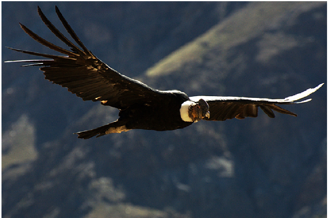
Figura 9. El cóndor ( Vultur gryphus ) es otro de los símbolos de nuestra cordillera, destacando por su majestuoso vuelo y gran envergadura