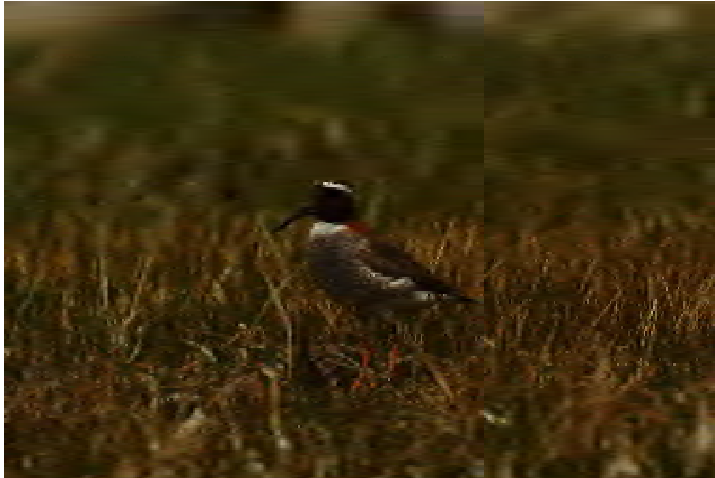
Figura 11. El chorlito cordillerano es difícil de avistar por lo remoto de su hábitat, pues sólo vive en vegas altoandinas