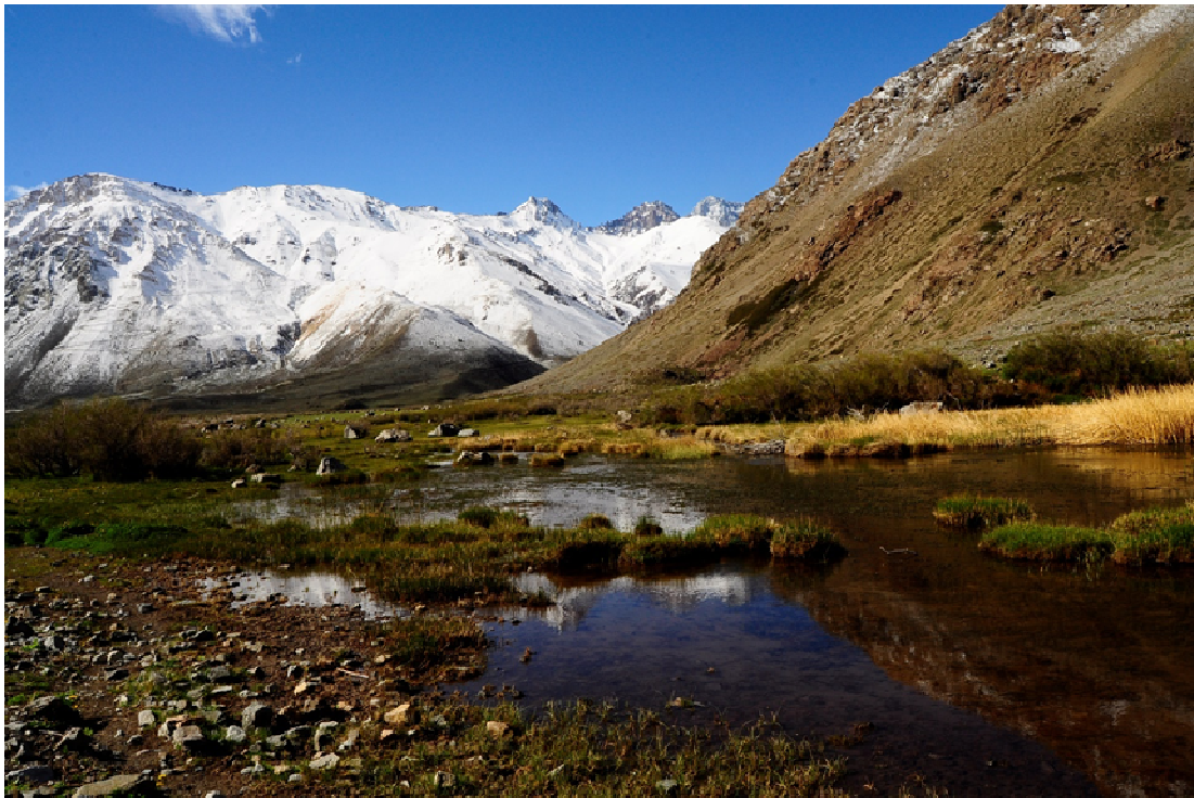
Figura 14. Vega del río Blanco, que alberga una gran riqueza de aves