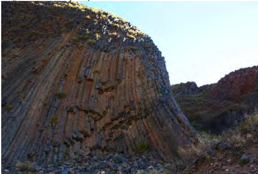
Figura 6. Columnas basálticas, a sólo kilómetros del Refugio Cruz de Piedra hacia la frontera con Argentina

Al interior del predio se encuentran numerosos glaciares, entre los que se pueden