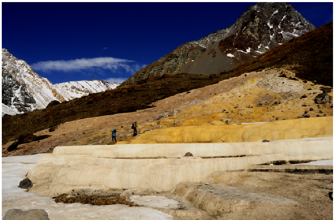
Figura 5. Baños de los Azules, peculiares piscinas de origen sedimentario