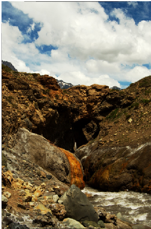
Figura 4. Puente de tierra, que conecta las riberas norte y sur del Maipo, y da el nombre a los baños termales