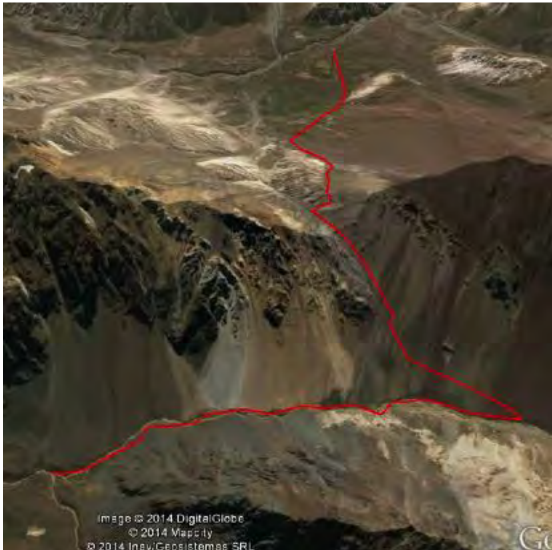
Figura 25. Travesía Los Azules- El Museo-Cruz de Piedra