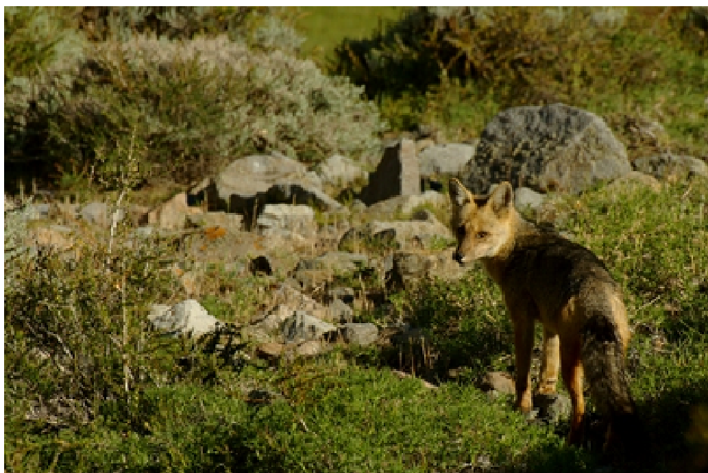
Figura 12. El zorro culpeo es un inteligente y curioso habitante de nuestra cordillera. Evitando movimientos bruscos y el acoso, es posible observarlo a escasos metros